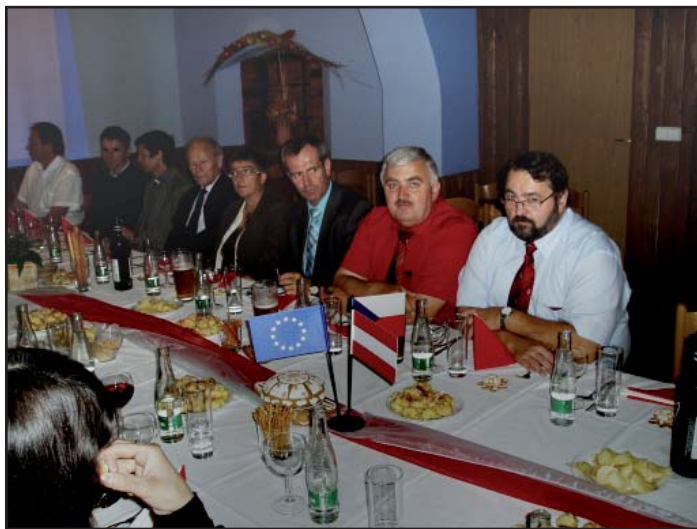
Zástupci partnerských obcí