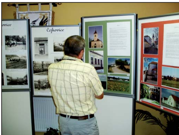
Výstava „Obce ve fotografii“