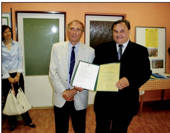
Předání čestné listiny