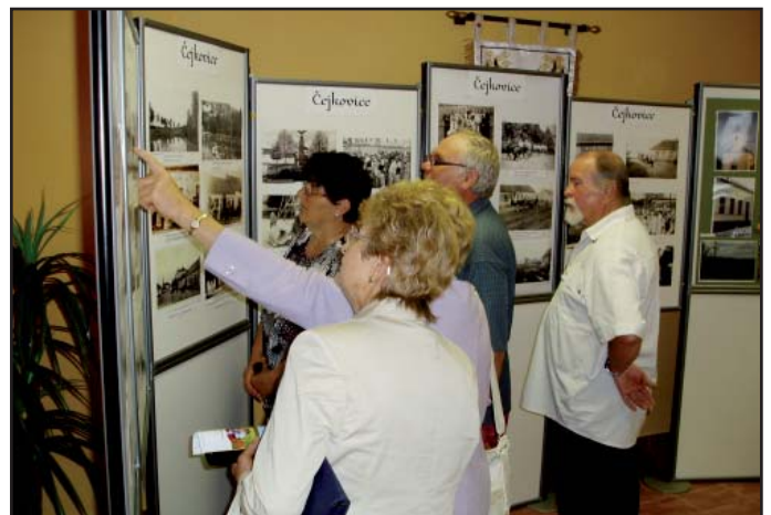
Výstava „Obce ve fotografii“