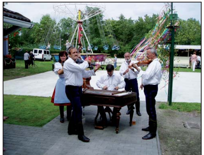
Přeshraniční slavnosti doprovázel bohatý kulturní program