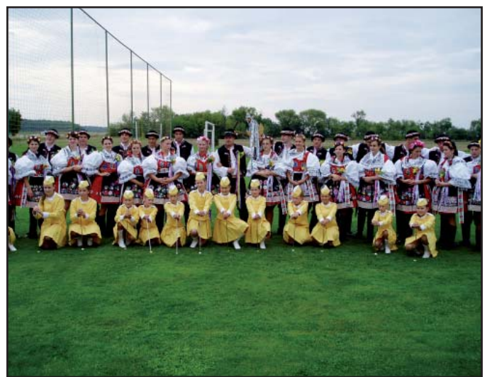
Čejkovická chasa s mažoretkami z Božic