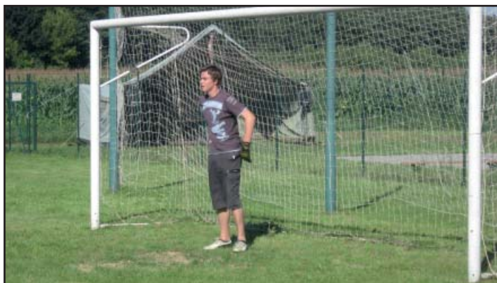
Kašence a čtvrté místo obsadilo družstvo obce Borotic.

Nádherný letní den byl ukončen večerní zábavou, kde hrála skupina DUO GUISEPPE.