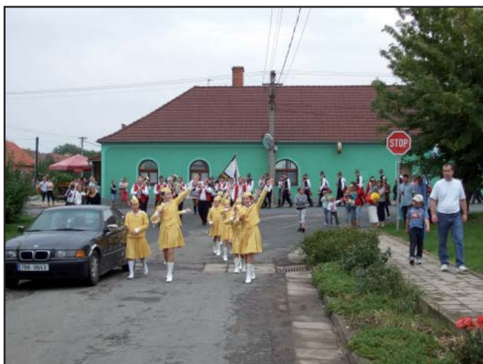
Slavnostní průvod vedly božické mažoretky