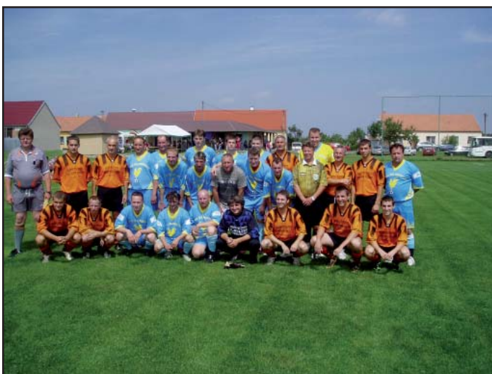
Hráči 1. FC Čejkovice a Hobbysportverein Zwingendorf