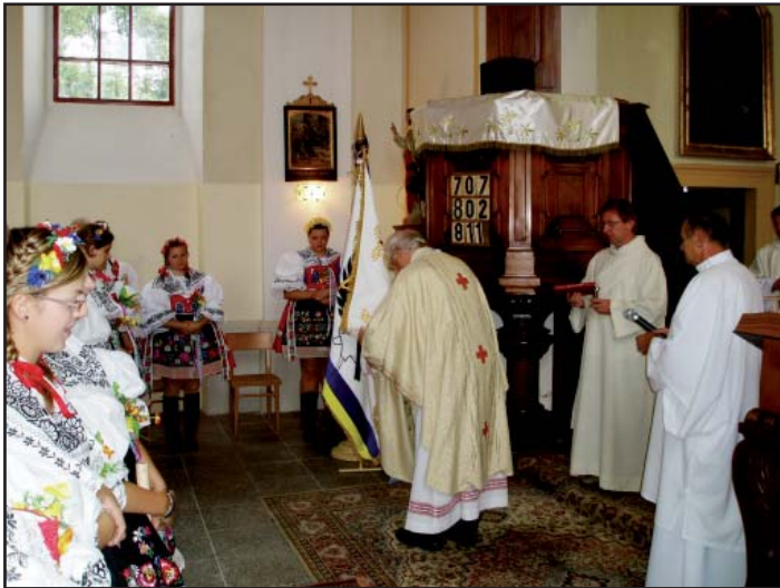
Žehnání obecního praporu